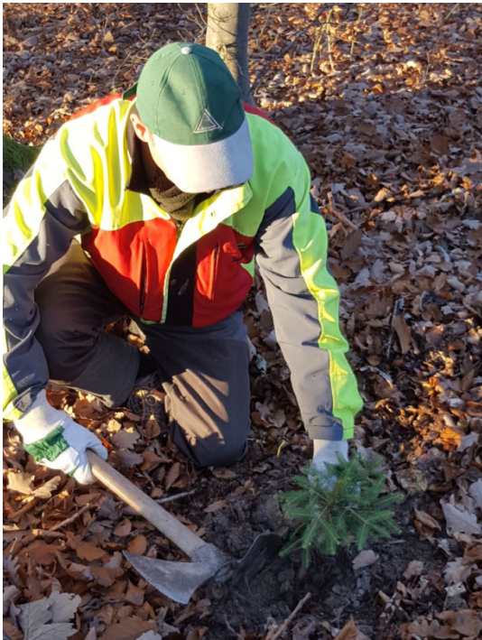
Waldarbeiter beim Pflanzen von Douglas-Tannen

Das Besprühen von großen Kahlflächen mit Saatgut wird derzeit vom Landesbetrieb Wald und Holz NRW getestet, Testflächen werden auch im Stadtwald Bad Münstereifel eingerichtet. Dieses Verfahren soll zu einer schnellen Vorwaldbegründung mit Pionierbaumarten führen, um in einigen Jahren weitere Baumarten gezielt im schattigen Schutz einbringen zu können.