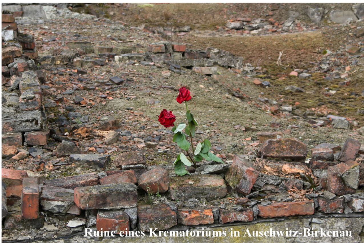
Ruine eines Krematoriums in Auschwitz-Birkenau