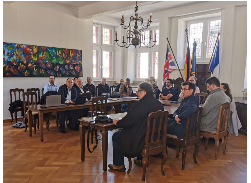
Die Teilnehmer/innen folgten interessiert den Vorträgen der Referenten.

Um Fehler bei Angebotsabgaben und der Erstellung von Ausschreibungsunterlagen zu vermeiden, hat die Stadt gemeinsam mit der Firma C&E und der Kanzlei CLP einen Workshop veranstaltet, auf dem sich Ingenieurbüros, Planer und Baufirmen über die Vergabe und das Fördermittelrecht im Rahmen des Wiederaufbaus umfassend informieren konnten.