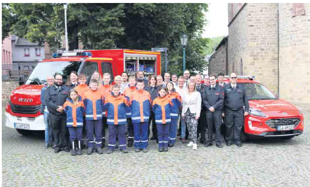
Mit dem neuen Tragkraftspritzenfahrzeug (l.) ist die stark vertretene Jugendfeuerwehr ab jetzt unterwegs. Den Kommandowagen (r.) nutzt der Bereitschaftsdienst, um die Einsatzorte schnell zu erreichen.

Seit wenigen Tagen erst im Besitz der Feuerwehr befindet sich der