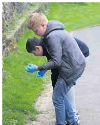
Akribisch suchten die Schüler das Gras ab.