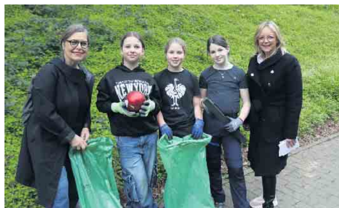
Weihnachten könnte kommen: Der Christbaumschmuck landete allerdings richtigerweise im Müllsack.

Arbeitsstunden aufwenden. Die entsprechenden Personalkosten beliefen sich auf rund 2600 Euro. Nicht eingerechnet ist dabei der Fahrzeugaufwand für den Abtransport. Für die reinen Entsorgungskosten - ohne Containermieten - mussten aus der Stadtkasse rund 15.500 Euro aufgewendet werden.