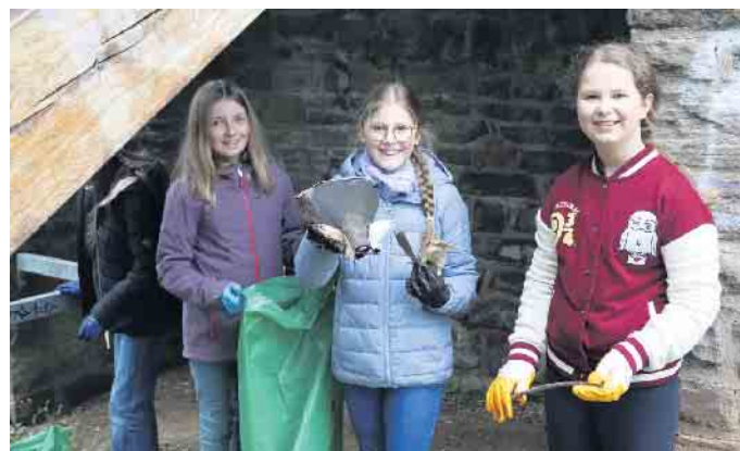
Ein Fahrradsattel zählte zu den „Schmuckstücken“, die die Schülerinnen des St. Michael-Gymnasiums aus dem Gebüsch zogen.