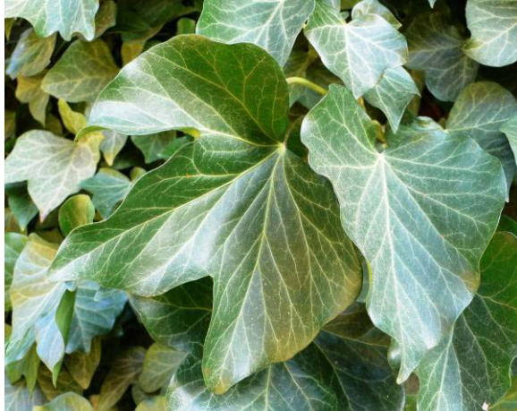
Hedera helix - Efeu

Der Efeu ist ein immergrüner, kriechender oder kletternder Strauch unserer Breiten, der zur Familie der Araliaceae gehört.